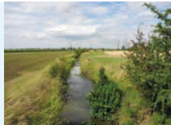
Gewässer mit Gewässerrandstreifen