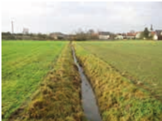
Gewässer ohne Gewässerrandstreifen