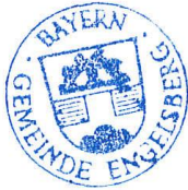
Martin Lackner Erster Bürgermeister